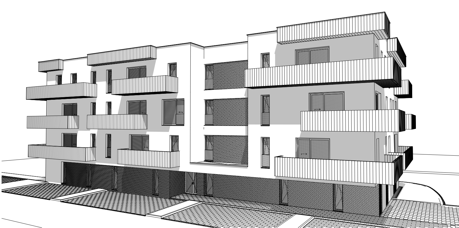
SCHÉMA 1: 750 P2